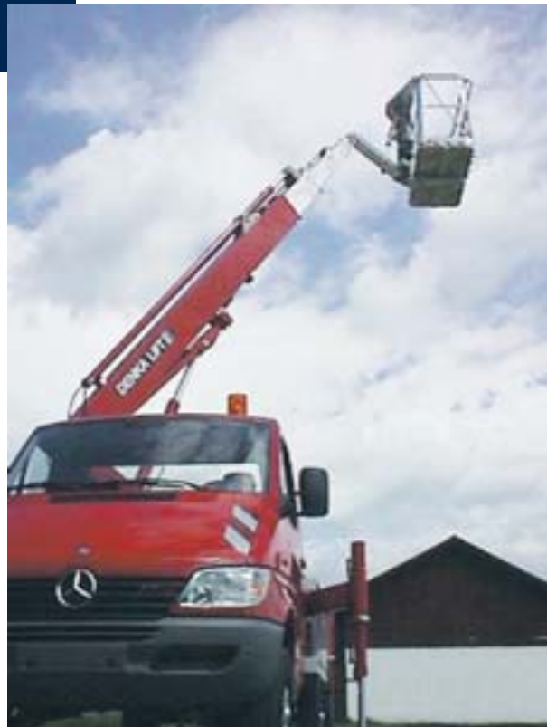
Der DL21T, wirtschaftliches Profi-Gerät in liebevoller Detailverarbeitung