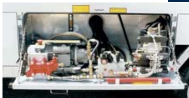
Wartungsfreundlich: die ausklappbare Hydraulikeinheit