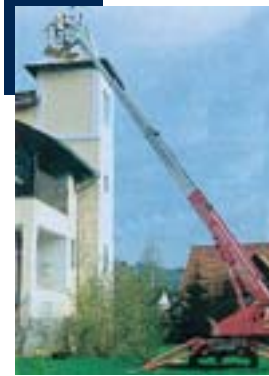
Fa Jost: Keine Gerüste mehr. Mit DENKA•LIFT geht's besser!

Wie mit der Arbeitsbühnenvermietung die klassischen Geschäftsbereiche lukrativ und zukunftsicher erweitert werden, das zeigt das aktuelle Beispiel der Fa. Jost aus A-8563 Ligist. Seit 3 Generationen ist das 1963 gegründete Unternehmen ein engagiert geführter Familienbetrieb. Die Unternehmensbereiche gliederten sich ursprünglich in Malerarbeiten, Autolackierungen, Fassadengestaltung und Sandstrahlarbeiten. Um flexibler, wetterunabhängiger und kostengünstiger arbeiten zu können, wurde schon vor einigen Jahren die erste DENKA•LIFT 1800 Arbeitsbühne gekauft. Ihr Nutzen für den Betrieb war überzeugend: weitaus mehr Aufträge konnten angenommen und wirtschaftlicher als zuvor ausgeführt werden. Kein Wunder also, dass bald weitere Arbeitsbühnen angeschafft - und parallel dazu ein neuer Geschäftsbereich gegründet wurde: die Arbeitsbühnen-Vermietung! So hat sich das kleine Familienunternehmen in kurzer Zeit zu einem Vorzeigebetrieb mit jetzt 25 Mitarbeitern entwickelt. Angeboten werden von „Jost Arbeitsbühnen“ heute DENKA•LIFT-Anhänger von 10 – 30 m, Selbstfahrer, LKW- und Scherenbühnen.