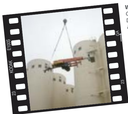
Winkler, Gera/Kleinfalke DENKA•LIFT 2500 auf dem Weg nach oben. Montage eines Mobilfunksenders auf einem 75 m hohen Agrarsilo.

Schicken auch Sie uns Ihr Einsatzfoto, es lohnt sich: wird Ihr Foto von uns hier abgebildet, erhalten Sie als Dankeschön-Prämie eine einsatzstarke DENKA•LIFT-Pilotenjacke.