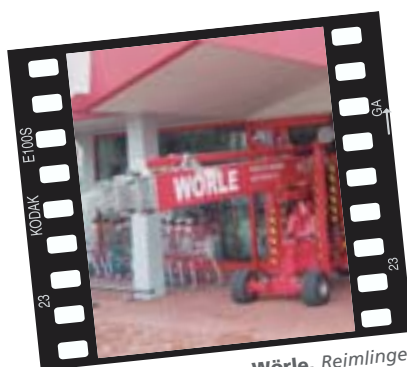
Wörle, Reimlingen Beim Einfahren ihres DENKA•LIFT NARROW DL 22 N im Möbelhaus Mahler. Dieses Spezialgerät kommt über die Weitervermietung an Vermieterkollegen bundesweit zum Einsatz.