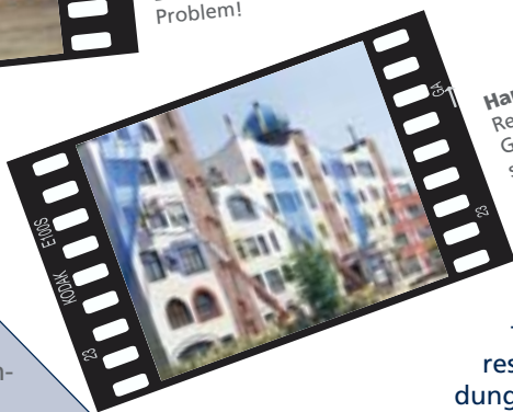
Handke, Wittenberg Restaurierungsarbeiten am Gymnasium Hundertwasserschule in Wittenberg.