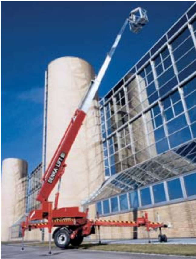
DENKA•LIFT DK 2500

Seit mehr als 14 Jahren auf dem Markt und in Deutschland über 500 mal verkauft: Der DENKA•LIFT DK 2500 (DK3-Chassis). Mit rund 2450 kg und einer Arbeitshöhe von 25 Metern ist er die leichteste Anhänger-Arbeitsbühne seiner Klasse.