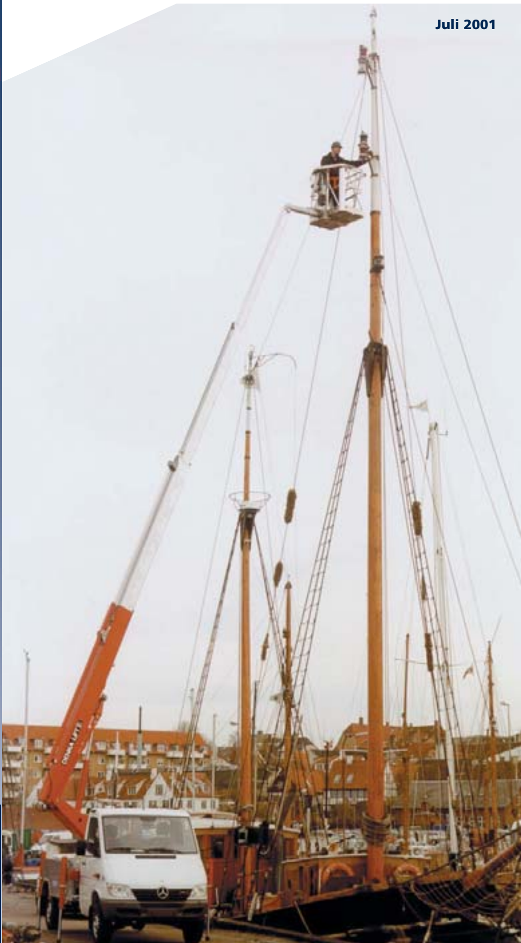
DENKA • LIFT DL 21 T am Hafen von Kopenhagen in Dänemark