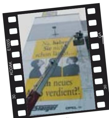
Danker, Brahmstedt Reinigungs- und Konservierungsarbeiten mit einem DENKA•LIFT 1800, hier an einem OPEL-Autohaus in Waiblingen.