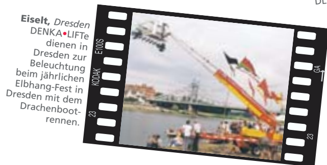
Eiselt, Dresden DENKA•LIFTe dienen in Dresden zur Beleuchtung beim jährlichen Elbhahn-Fest in Dresden mit dem Drachenbootrennen.