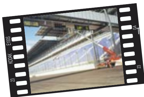
Förster, Hohenbocka Lampenwechsel an der Startampel auf dem Eurospeedway Lausitzring; mit dem DENKA•LIFT 1800 kein Problem!