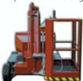
Dino mit 2 x 90°-Drehkorb