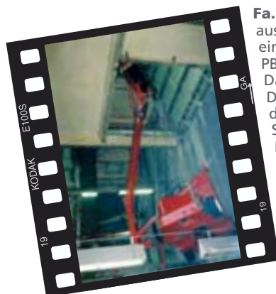
Fa. Junga aus Bernsdorf mit einem Einsatz des PB-DINO 1120. Das Foto zeigt den DINO wie er gerade durch einen Schacht in den Kraftwerksbe- reich des ehemali- gen "Gaskombi- nates-Schwarze- Pumpe" gehievt wird.