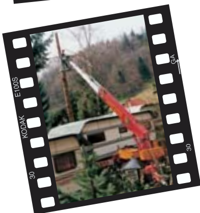
Fa. Seeböck am Campingplatz in Tünnitz bei Baumfällarbeiten

Auch bei der nächsten Ausgabe des Bühnenspiegels ist diese Seite für Ihre Einsatzfotos reserviert. Die Einsendungen der in der nächsten Ausgabe veröffentlichten Einsatz-Fotos werden mit einer Original DENKA-LIFT-Pilotenjacke belohnt.