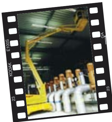
Fa. Wagert aus Bayreuth im Einsatz mit dem PB Dino 1120