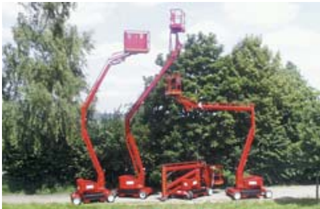
Dino-Familie, Selbstfahrer von 10,50 bis 12,60 m Arbeitshöhe

1999 hat dann PB Lifttechnik GmbH mit der finnischen Firma Dino Lift Oy ein Markenlizenzvertrag geschlossen, in dem der Firma DINO Lift Oy die Verwendung der Bezeichnung "DINO" für Anhängerarbeitsbühnen und LKW-Bühnen erlaubt wurde.