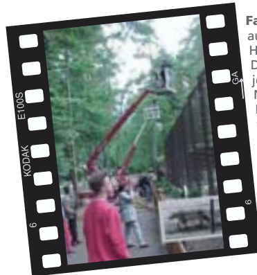
Fa. Otte aus Garlstorf am Walde bei Hamburg hatte zwei seiner DENKA-LIFTe zusammen mit je einem Kamerateam des NDR im "Wildpark Lüneburger Heide" im Einsatz. Dort wurden zwei Schnee- leoparden gefilmt die ihre ersten Schritte ins Freigehege unternahmen. Besonders gelobt wurden von den Kamerateams die Laufruhe, die ruckfreie Steuerung und der bodenschonende Transport der DENKA-LIFTe.