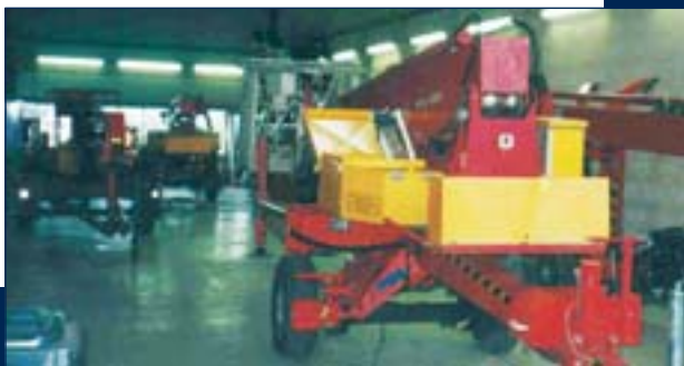
Genug Arbeits- und Stellplatz auch bei größeren Reparaturen ...