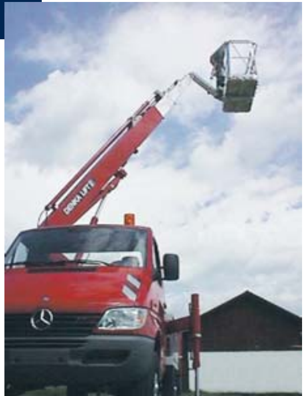
Der DL21T, wirtschaftliches Profi-Gerät in liebevoller Detailverarbeitung