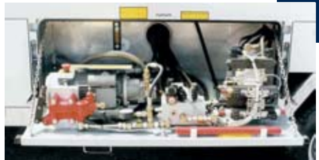
Wartungsfreundlich: die ausklappbare Hydraulikeinheit